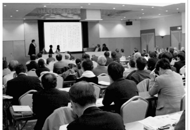
シンポジウム会場